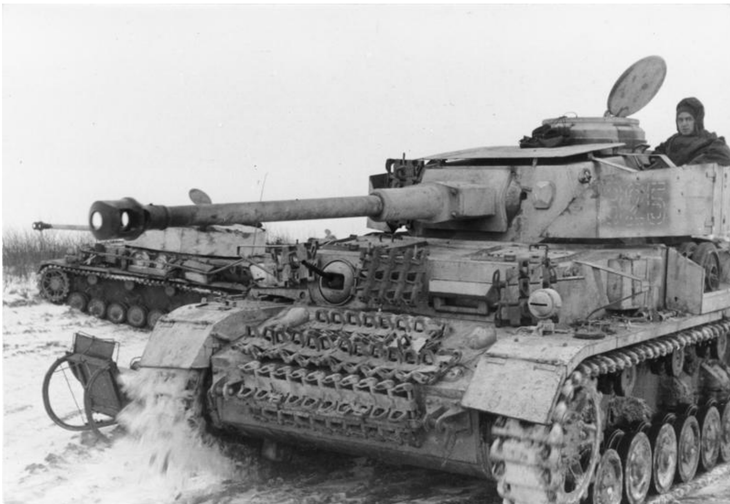
1943 Winter

Trotz konventioneller Formgebung war der Panzer IV ein kampfstarkes Fahrzeug. Die späteren Ausführungen waren dem T-34 bis zur Einführung des T34/85 weit überlegen. Wer das auch bei Wot Blitz erwartet, dürfte sich enttäuscht sehen.