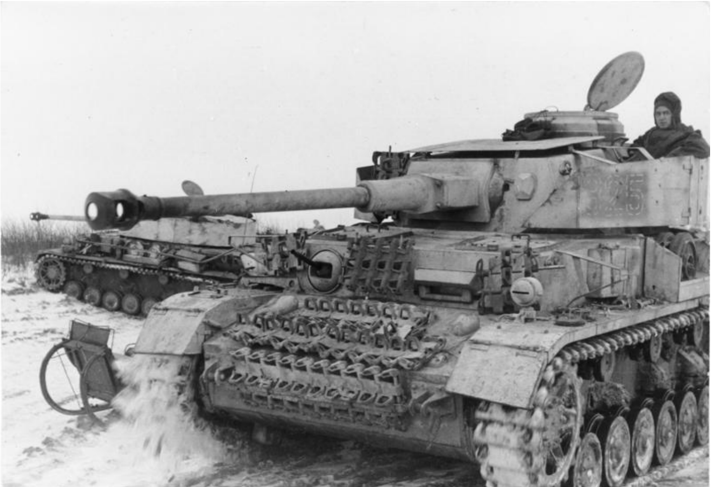
1943 Winter

Trotz konventioneller Formgebung war der Panzer IV ein kampfstarkes Fahrzeug. Die späteren Ausführungen waren dem T-34 bis zur Einführung des T34/85 weit überlegen. Wer das auch bei Wot Blitz erwartet, dürfte sich enttäuscht sehen.