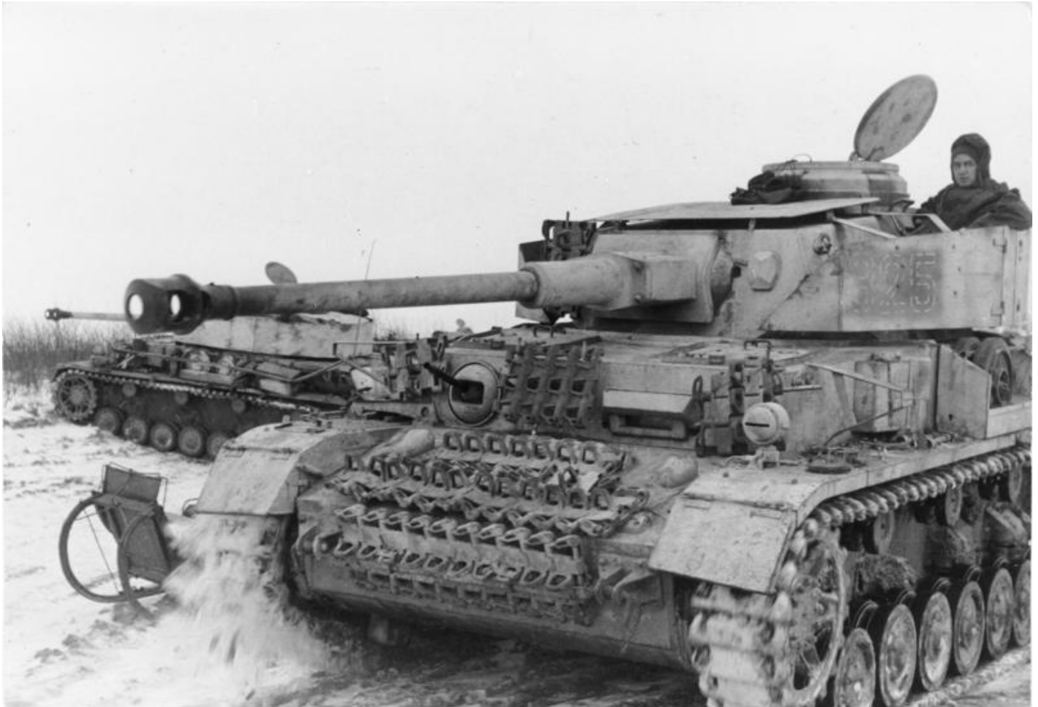
1943 Winter

Trotz konventioneller Formgebung war der Panzer IV ein kampfstarkes Fahrzeug. Die späteren Ausführungen waren dem T-34 bis zur Einführung des T34/85 weit überlegen. Wer das auch bei Wot Blitz erwartet, dürfte sich enttäuscht sehen.