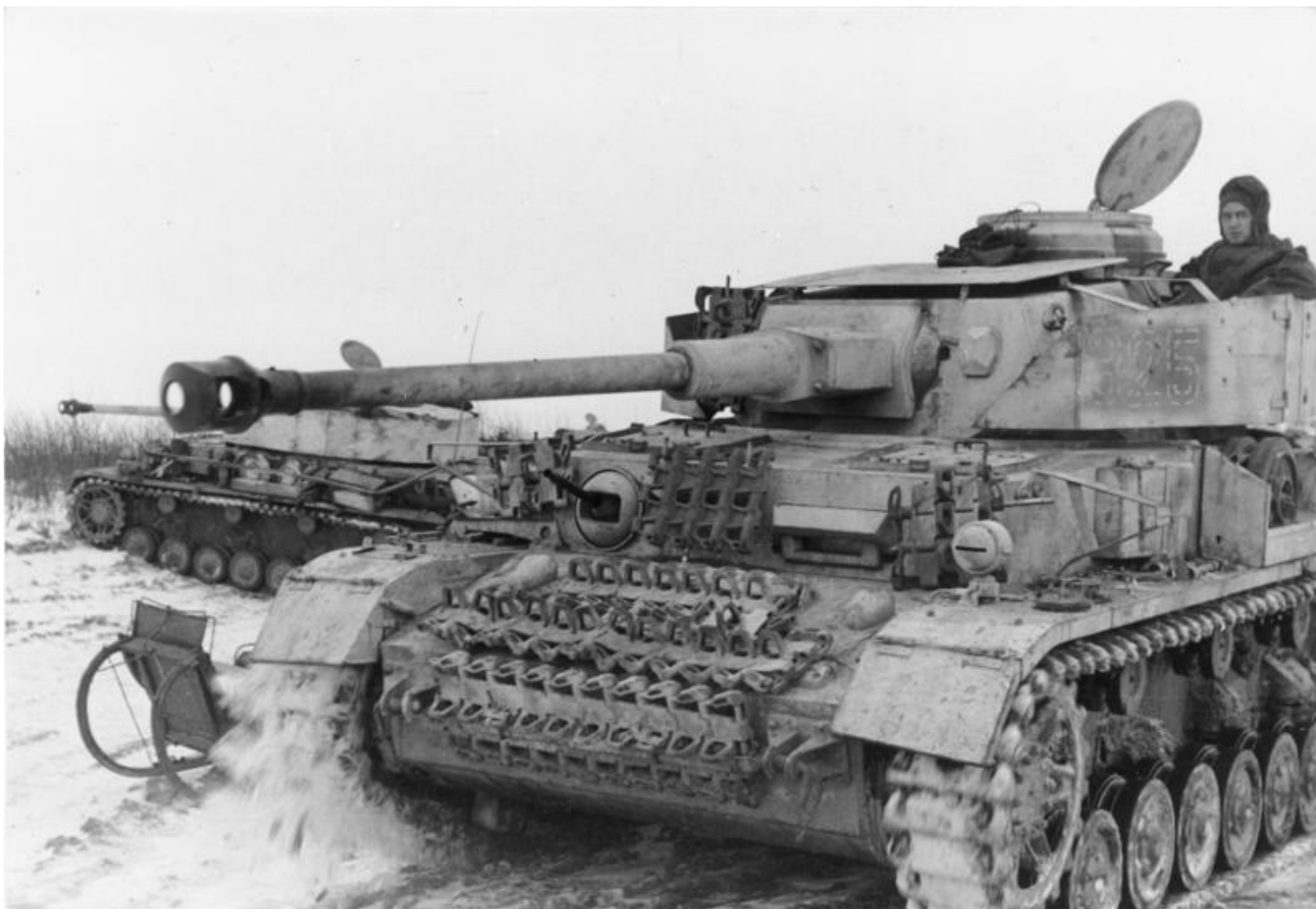
1943 Winter

Trotz konventioneller Formgebung war der Panzer IV ein kampfstarkes Fahrzeug. Die späteren Ausführungen waren dem T-34 bis zur Einführung des T34/85 weit überlegen. Wer das auch bei Wot Blitz erwartet, dürfte sich enttäuscht sehen.