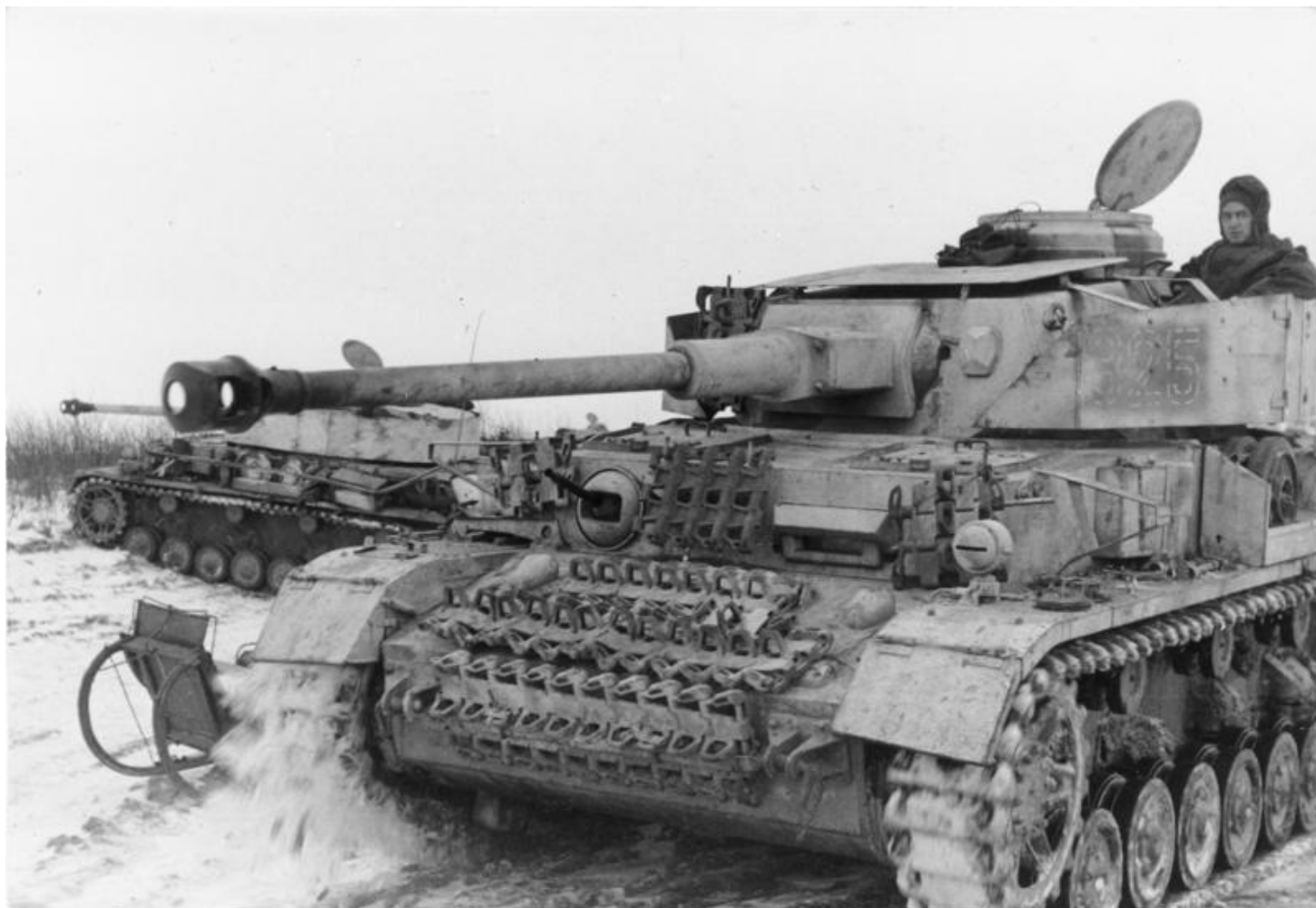
1943 Winter

Trotz konventioneller Formgebung war der Panzer IV ein kampfstarkes Fahrzeug. Die späteren Ausführungen waren dem T-34 bis zur Einführung des T34/85 weit überlegen. Wer das auch bei Wot Blitz erwartet, dürfte sich enttäuscht sehen.