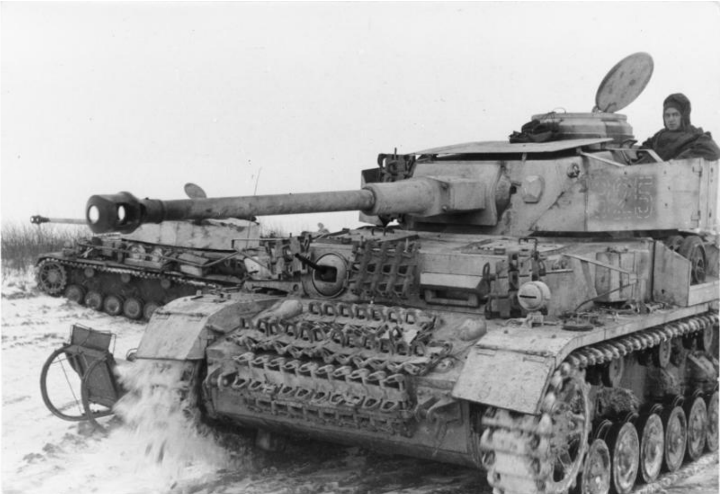
1943 Winter

Trotz konventioneller Formgebung war der Panzer IV ein kampfstarkes Fahrzeug. Die späteren Ausführungen waren dem T-34 bis zur Einführung des T34/85 weit überlegen. Wer das auch bei Wot Blitz erwartet, dürfte sich enttäuscht sehen.