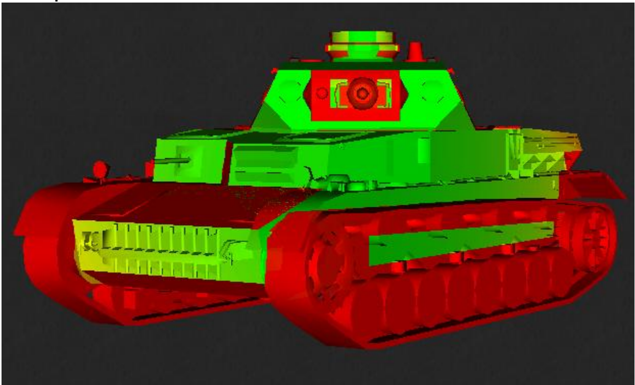
Der Pz. IV D aus Sicht eines Pz. 38 t mit Stock-Kanone (Tier 2): Panzerung praktisch nicht vorhanden.