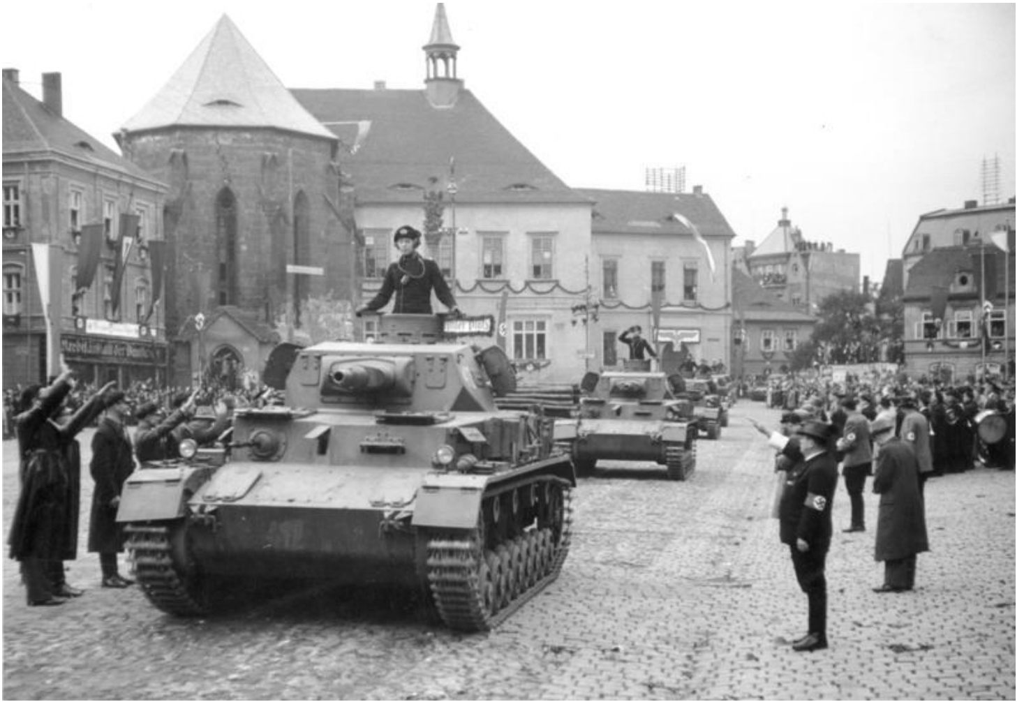
Panzer IV Ausf. A mit noch innenliegender Walzenblende und erkennbar vorgezogenem Fahrerkerker beim Einmarsch in das Sudetenland 1938