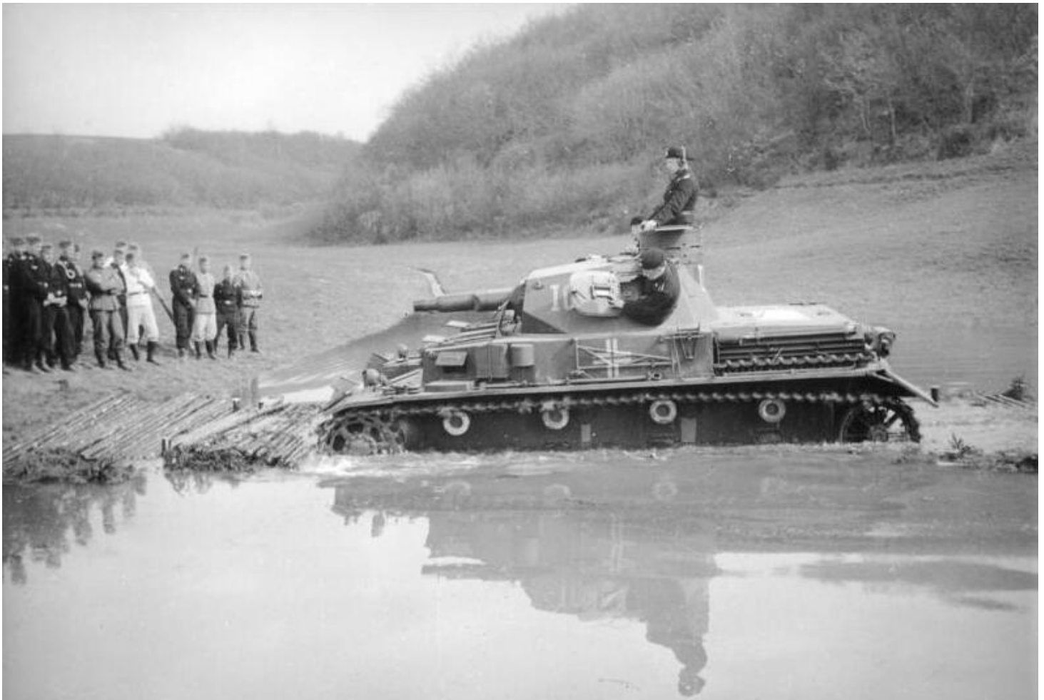
Panzer IV Ausf. A beim Durchfahren eines Gewässers- Übung / Vorführung [?] vor Wehrmachtsangehörigen u.a. der Panzertruppe am Ufer